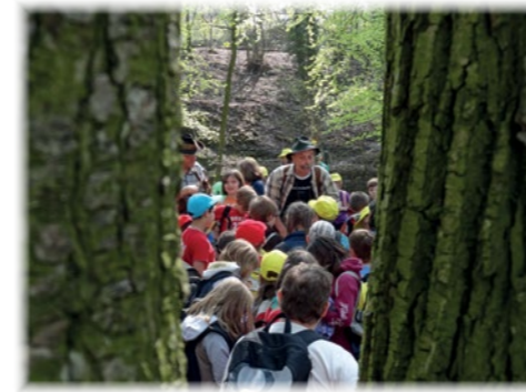
Erzählprojekte in freier Natur sind nicht nur für Schulen meist besonders stimmig.

Bei Erzählprojekten für Kinder und Jugendliche wird schnell klar: Die wollen es wissen! - Sie haben schon verstanden, dass die Welt, so wie sie bei uns erlebt und medial inszeniert wird, nicht alles ist. Drum wollen sie wissen, was es da noch alles gibt. Welche Gefahren lauern hinter dem Vordergründigen? Aber auch: welche Herausforderungen können auf mich zukommen? Und: welche Möglichkeiten gibt es damit umzugehen?