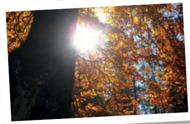
Grünau im Almtal, Herbst 2013