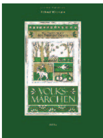
DAS GROSSE BUCH DER ÖSTERREICHISCHEN VOLKSMÄRCHEN

▼ Die CDs gibt's nur bei uns! - Die Bücher überall im Buchhandel! ▼