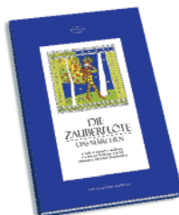
CD »DIE ZAUBERFLÖTE ~ DAS MÄRCHEN«

Der großformatige Band für die ganze Familie mit Volks- und Zauber mär- chen aus allen Gegenden Österreichs, 224 Seiten, mit Leseband € 25,-