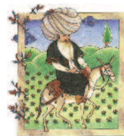
CD »G'SCHEIT ~ DUMM«

Die öö. Bläusersolisten spielen die Musik der Oper auf Holzblasinstru- menten. Eingewoben wird die Zauberflöte erzählt als das, was sie ist - ein Märchen. € 18,-