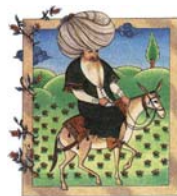
CD G'SCHEIT ~ DUMM

Die öö. Bläuersolisten spielen die Musik der Oper auf Holzblasinstru- menten. Eingewoben wird die Zauberflöte erzählt als das, was sie ist - ein Märchen. € 18,-