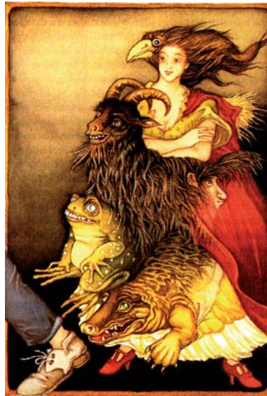
Manchmal brauchts nur einen saftigen Kuss um das Ungeheuer zu erlösen. Oft kostet gerade der aber einige Überwindung. (Illustration Helga Gebert, aus »Woher und wohin? - Märchen der Frauen«)

Eine chinesische Überlieferung erzählt: Ein Mann träumte, er wäre ein Schmetterling. Entspannt flog er von Blume zu Blume. Sein Mensch-sein hatte er ganz und gar vergessen. Beim Erwachen merkte er verblüfft, dass er ein Mensch war. Verwundert fragte er sich: Bin ich jetzt ein Mensch, der träumte, ein Schmetterling zu sein? Oder gar ein Schmetterling, der träumt, ein Mensch zu sein? - Wer weiß das schon so genau? - HeWi