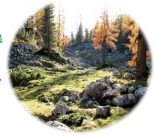
Jahrhundertealte Lärchenhaine, blühende Almwiesen, ein weiter Blick rundum: So lebendig zeigt sich das Tote Gebirge

PS: Viele aktuelle Infos, Fotos und mehr sind im Netz unter http://web.mac.com/wittmanns/Wittmann's_Blog/Willkommen.html zu finden! Einfach auf »Blog« klicken und los gehts!