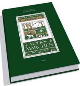
DAS GROSSE BUCH DER ÖSTERREICHISCHEN VOLKSMÄRCHEN

▼ Die CDs gibt's nur bei uns - Tel. +43-(0)7616-8107 - Die Bücher überall im Buchhandel! ▼