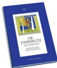
CD »DIE ZAUBERFLÖTE ~ DAS MÄRCHEN«

Der großformatige Band für die ganze Familie mit Volks- und Zaubermär- chen aus allen Gegenden Österreichs, 224 Seiten, mit Leseband € 25,-