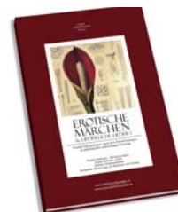
CD »EROTISCHE MÄRCHEN & LIEDERLICHE LIEDER«