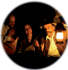
Neu: Das Programm »Voll Mond« mit dem Duo La Perla - Mandoline, Gitarre und Diskantlaute.