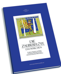
CD »DIE ZAUBERFLÖTE ~ DAS MÄRCHEN«