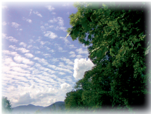
Ruhig sitzen. Nichts tun. Der Sommer ist da. Die Früchte reifen. (aus einem japanischen Koan)

Aber wer erzählt vom Wert der Stunden in denen der Geist zur Ruhe kommt und sich weitet, in denen Zeit & Muße ist neue Eindrücke wirken zu lassen und unverhoffte Einfälle einzufangen.