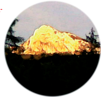
Der Redende Stein im Toten Gebirge. Im Schein der untergehenden Sonne hat er seinen ganz eigenen Zauber.

PS: Für Menschen, die mit Wandern nicht viel am Hut haben, sondern am liebsten in der Wiese oder im Heu liegen um entspannt Saitenmusik & Märchen zu lauschen, ist das neue Programm »Voll Mond« das Richtige. Premiere ist am 17. Juli am Schindlbachgut. Tags darauf sind wir in Kapfenberg, am 16. August auf Burg Gallenstein im Nationalpark Gesäuse.