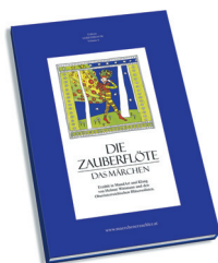
CD »DIE ZAUBERFLÖTE ~ DAS MÄRCHEN«