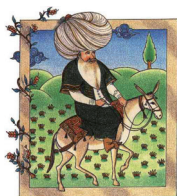
CD G'SCHEIT ~ DUMM

▼ Die CDs gibt's nur bei uns! - Tel. + Fax 0(043)7616-8107 - Die Bücher überall im Buchhandel!